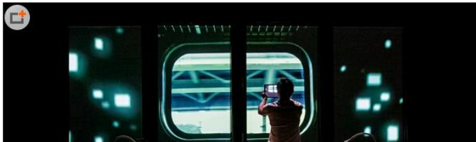
《我和我的午茶时光》，导演只负责情境，观众需补充故事 (2)