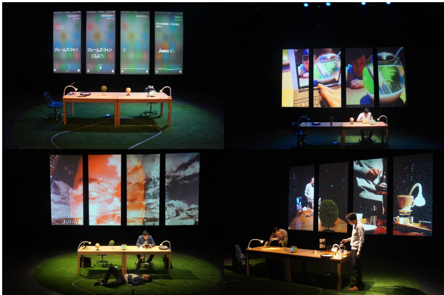
北京 國話先鋒劇場 演出劇照