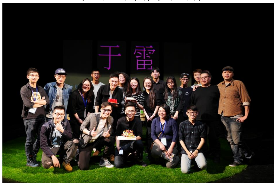
排練期與北京劇組工作人員合照